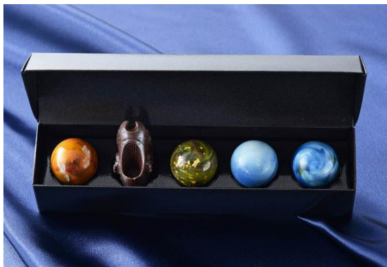
宇宙へ旅立つ「宇宙戦艦ヤマト」やアニメに登場する惑星を表現したチョコレート「宇宙の輝き ～宇宙戦艦ヤマト 2199 スペシャル～」