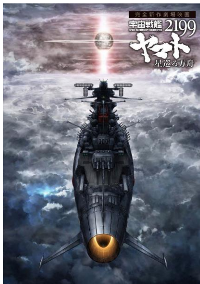
「宇宙戦艦ヤマト」艦体イメージ画像 (c) 西崎義展/2014 宇宙戦艦ヤマト 2199 製作委員会