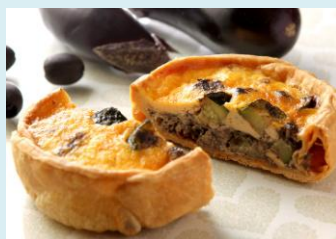
夏野菜とツナのキッシュ