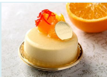
オレンジ オレンジとパッションのムース