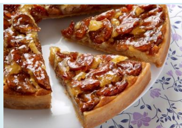
フランス産ミラベルのタルト