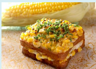
とうもろこしのクロックムッシュ