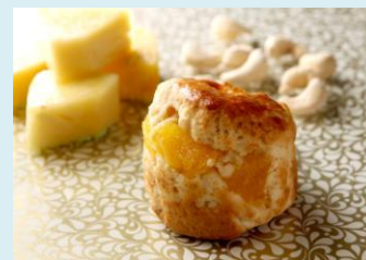
パイナップルと ココナッツのスコーン ※六本木店限定