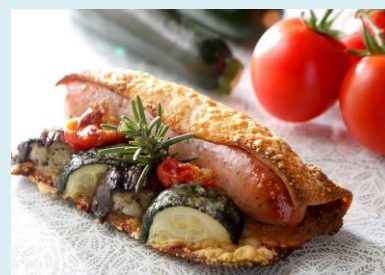
ハーブソーセージと夏野菜