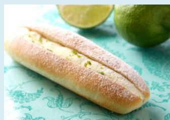
ライムクリームの ミルクフランス