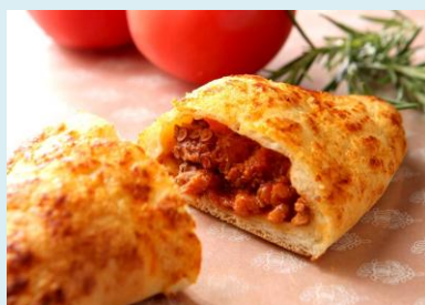
トマトとタコのフォカッチャ