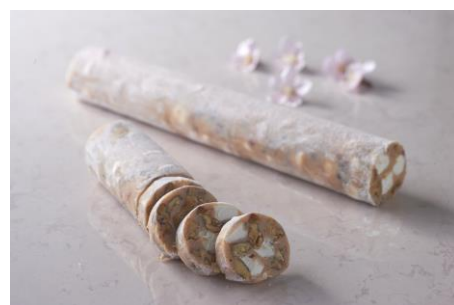
サラーム デイ チョココラート サクラ

まるでサラミのような外観が人気のチョコレートの桜バージョン。桜風味のチョコレートにギモーブやピーカンナッツ、カシューナッツなどのナッツがたっぷり入っています。