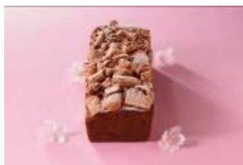
桜パウンドケーキ