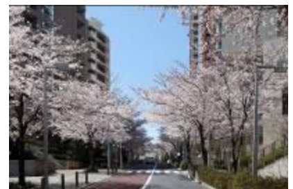
(上) 毛利庭園 (下) 六本木さくら坂