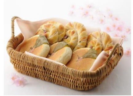
(上) 桜花あんぱん (下) 桜の葉あんぱん

ミルクロールの生地に、桜餡を練り混ぜ、桜の花の形に焼き上げました。パン生地の優しい甘さと桜餡のほのかな甘みがマッチした春らしいパンです。