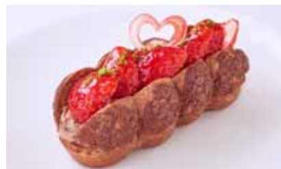
「フルーツパトッシュー フリーズショコラ」 ¥734 (クレーム デ ラ クレーム)

※2名様用(ドリンク付)、前日までに要予約。 苺、オレンジ、キウイ、ブルーベリー、マンゴー、フランボワーズの6種類。