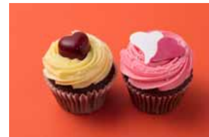
ローラズ・カップケーキ 東京 「バレンタイン・カップケーキ」 ¥648 ふんわりチョコレート生地にバニラクリーム。キュートなシュガーのハートが大人っぽいチョコレートハートをのせて。