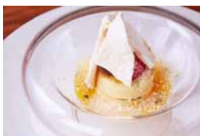
(左)「ブラリネクリームとショコラのパフェとローズヒップとハイビスカスのハーブティー」(THE SUN)