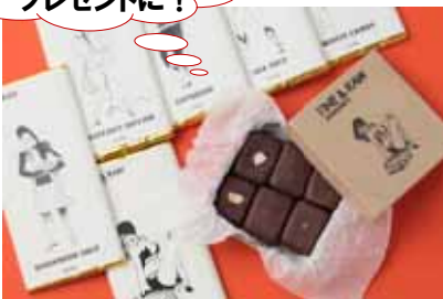
エストネーション 「トラッフルチャンキー」16個入り ¥3,456 「ピーントッパー」¥1,836 ブルックリン発のピーントッパーチョコレート。全ての原材料がオーガニック。