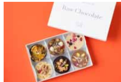
イル カフェ 「ローチョコレート」 ¥4,104(6枚セット) オーガニックカカオを使用し、非加熱で全て手作業で仕上げたローチョコレート。