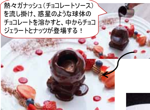
「ドーム ショコラ」 ¥1,620 (ヒルズ ダル・マツ)

熱々ガナッシュ(チョコレートソース)を流し掛け、惑星のような球体のチョコレートを溶かすと、中からチョコジェラートとナッツが登場する！ 温かいチョコレートと、ひんやりしたチョコレートアイスが絶妙なハーモニーを奏でる新感覚のスイーツ。視覚的にも、味覚的にも変化が楽しめるアトラクション型のスイーツ。プレートの上に添えられたフレッシュなイチゴと、ブルーベリーと絡めて食べると、より一層バレンタイン気分が高まります。