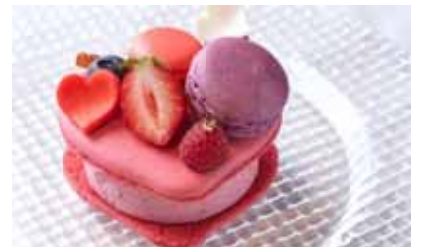
「ほろよい 大人のチェリーマカロン」 ¥730 (毛利 サルヴァトーレ クオモ)

ベルギー産チョコレート2種類のクリームをたっぷり挟んだエクレア。苺の酸味がアクセントです。