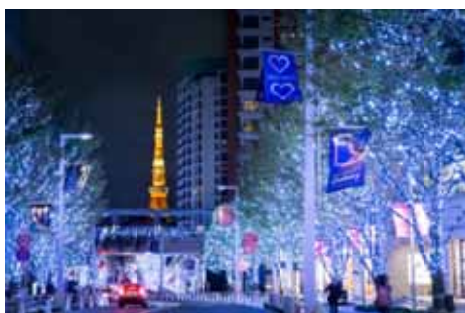
“SNOW & BLUE”