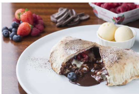
デザートピッツア