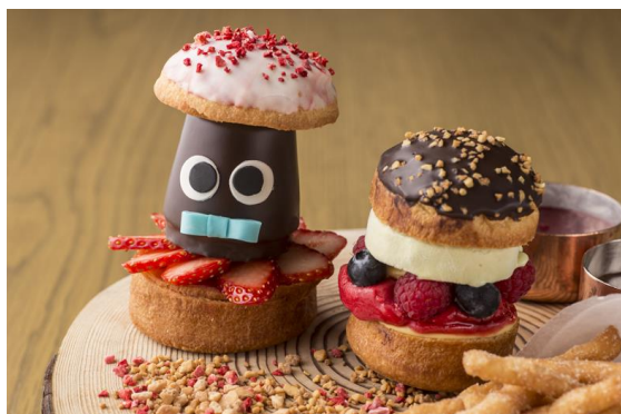
Mr.&amp;Mrs. チョコレートバーガー