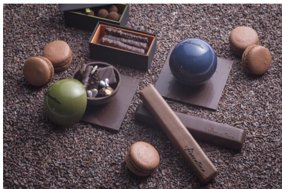
バレンタイン スイーツ

都会の喧騒にそびえたつダイナミックなラグジュアリーホテル、グランド ハイアット 東京(東京都港区、総支配人: スティーブ ディワイヤ)は、大切な方との特別な日“バレンタイン&ホワイトデー”のためのチョコレートスイーツや、チョコレートをつかったスペシャルメニューを2017年2月1日(水)より<ホワイトデーは3月1日(水)より>各レストランで展開いたします。