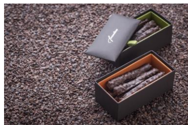
オレンジジェット

オレンジピールにチョコレートをコーティングしたオレンジジェット。フランス産のほろ苦くジューシーなオレンジとカカオ本来のアロマが香る厳選されたチョコレートの絶妙なバランスをお楽しみください。