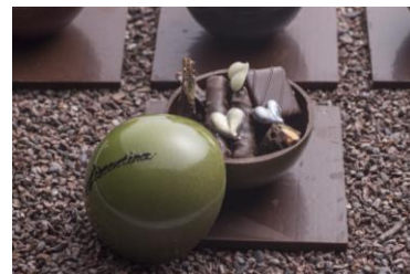
ショコラ コスモス