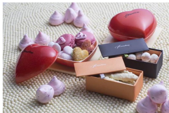
ホワイトデー スイーツ