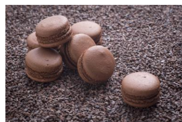
マカロン ショコラ

中はしっとりしたチョコレート風味のマカロン。ご友人やご家族へのプレゼントに最適です。