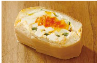
たまご egg ¥346