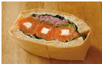
スモークサーモンとフロマージュ ¥432