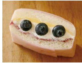
ブルーベリーのカスタードホイップ ¥303