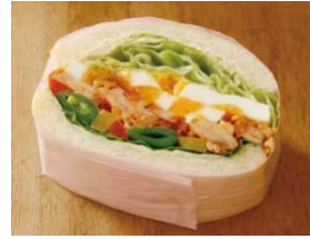
タンダリーチキンとひよこ豆 ¥454