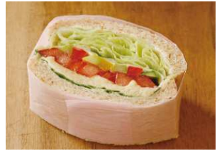
ひよこ豆のサラダサンド ¥432