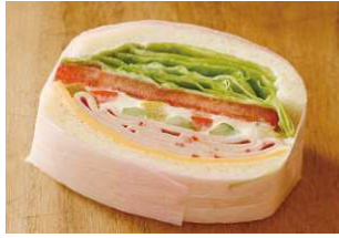
モルタデラ・ベジタブル ¥432