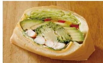
アボガドとエビのプロッコリー ¥454