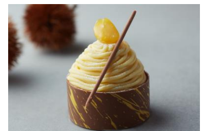
ルレ オ マロン