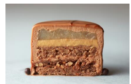
カットしたイメージ