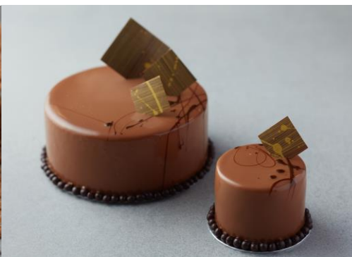
洋梨とキャラメルのみース