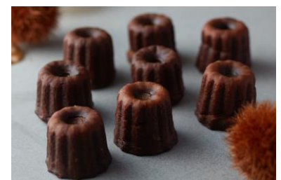
カヌレ オ マロン