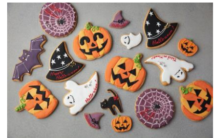
ハロウィンクッキー