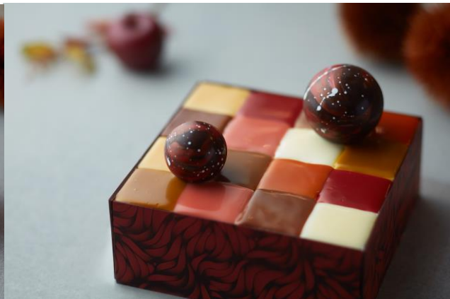
オータム モザイクケーキ