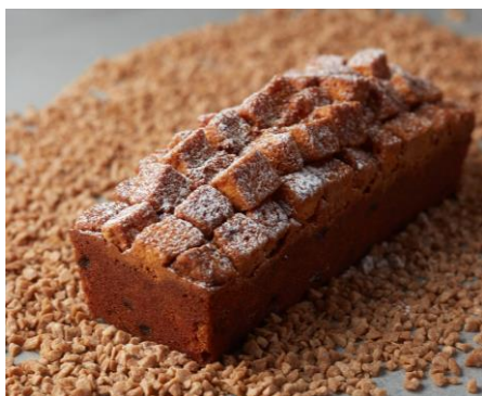
メープルパウンドケーキ