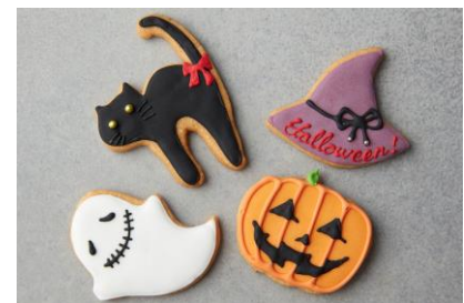
ハロウィンクッキー アソート