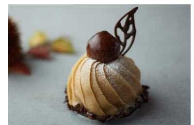
モンテピアンコ ジャポネーゼ