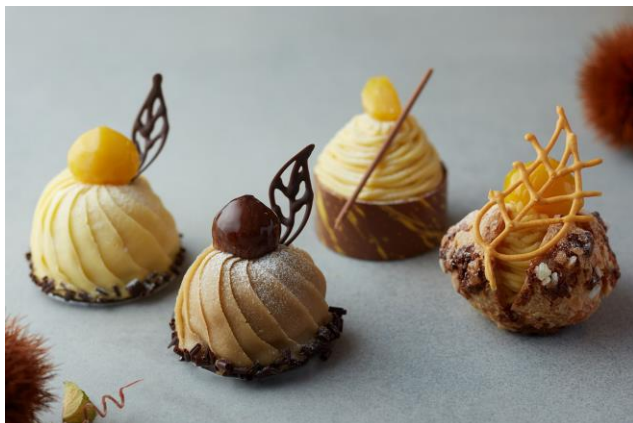
栗をつかった秋の新作ケーキ

都会の喧騒にそびえたつダイナミックなラグジュアリーホテル、グランド ハイアット 東京(東京都港区、総支配人：スティーブ デイワイヤ)は、栗や洋梨、かぼちゃ、リンゴなど、この時期にしか味わうことができない新作スイーツや、可愛らしいハロウィンモチーフのスイーツをご用意いたします。実りの秋にふさわしい旬の素材を存分につかった味わい深いスイーツをぜひご堪能ください。