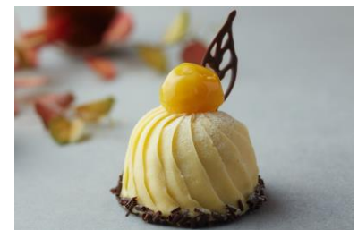
モンテピアンコ フレスコ