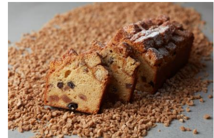
メープルパウンドケーキ