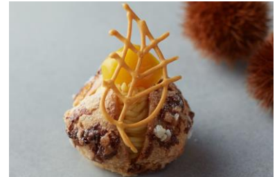
シュー オ マロン

外側はカリカリ、中はもっちりとした食感のフランス・ボルドー地方の伝統菓子、カヌレにマロンを合わせた秋の新作です。ラム酒を加えたカスタードクリームに、マロンパウダーと小麦粉の代わりに米粉を混ぜ合わせて焼き上げ、しっとり口どけ良くお召し上がりいただけます。蜜蝋の深みのある味わいと栗の絶妙な味わいをお楽しみください。