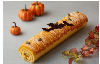
パンプキンロールケーキ