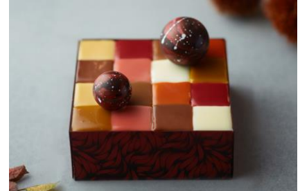
オートム モザイクケーキ