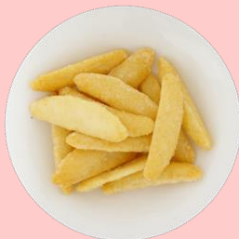
ロングバッグ スモークチーズ味