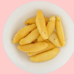
ロングバッグ かきたねポテト チーズ味