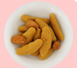
キューブ かきたねショコラ かきたねポテト 塩キャラメルショコラ