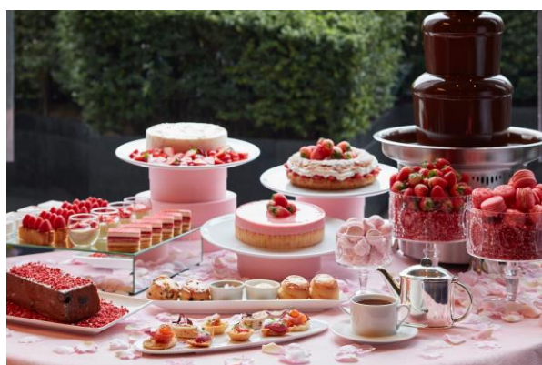
ストロベリー アフタヌーンティー(イメージ)