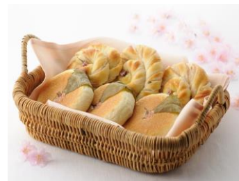
桜の葉あんぱん/桜花あんぱん

ミルクロールの生地に、桜餡を練り混ぜ、桜の花の形に焼き上げました。パン生地の優しい甘さと桜餡のほのかな甘みがマッチした春らしいパンです。