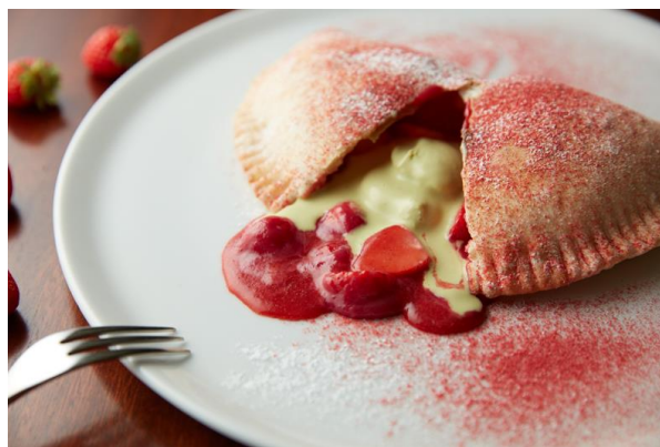
ストロベリーカルツォーネ