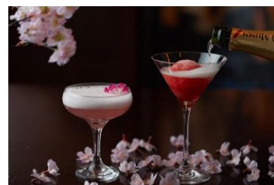
桜色カクテル「桜」(左) 桜のシャンパンソルベ (右)