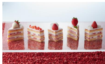
苺ショートケーキ