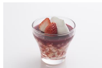
ストロベリーベリーヌ