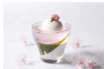
桜ブランマンジェ

トップに生クリームと桜の花びらの塩漬けが飾られた桜ゼリーと桜風味のブランマンジェの2層のベリース。