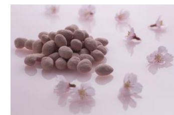
桜アマンディーヌ