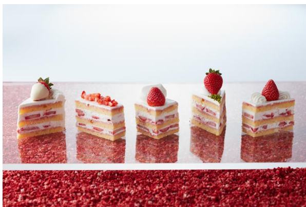
苺ショートケーキ

都会の喧騒にそびえ立つダイナミックなラグジュアリーホテル、グランド ハイアット 東京(東京都港区、総支配人: スティーブ ディワイヤ)は、春の訪れが待ち遠しくなる“苺”や“桜”をつかった期間限定のスイーツをはじめ、アフタヌーンティーやカクテルなど可愛らしい赤やピンクの限定メニューをご用意いたします。