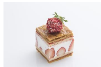
苺のミルフィーユ