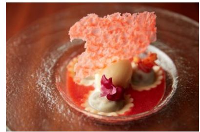
チョコレート ラヴィオリ

イタリア料理で定番のラヴィオリをスープデザートとしてご用意いたします。ローズヒップを練りこんだパスタ生地でチョコレートを包んだラヴィオリを、苺のスープに浮かべました。ストロベリー味の砂糖菓子を添えた自家製バニラアイスとともに、新感覚のデザートパスタをお楽しみください。