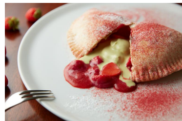
ストロベリーカルツォーネ