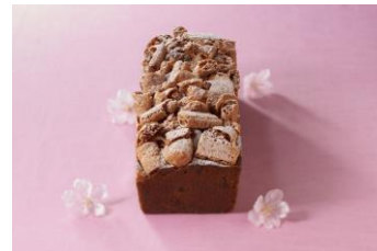
桜パウンドケーキ

桜風味の生地と、素朴な甘さの小豆が絶妙にマッチ。トップには、可愛らしい春色のマカロン生地が飾られ、サクサクの食感もお楽しみいただけます。