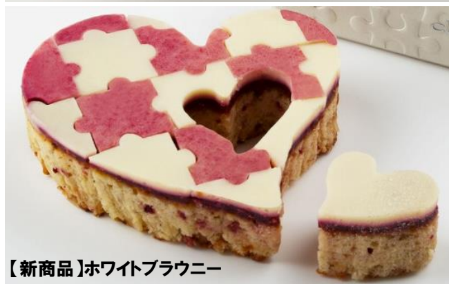
【新商品】ホワイトブラウニー