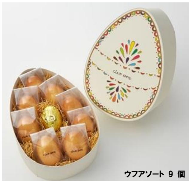
ウフアソート 9 個